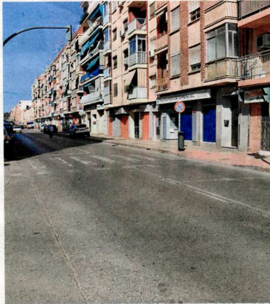
El aspecto actual de un tramo de la calle Camí Reial.

Esta vía une la calle Valencia con la carretera de Montserrat, por lo que presenta una gran cantidad de tráfico rodado, pese a que su uso mayoritario es residencial. Por ello, las obras quieren cambiar la percepción actual del vial asociada a carretera