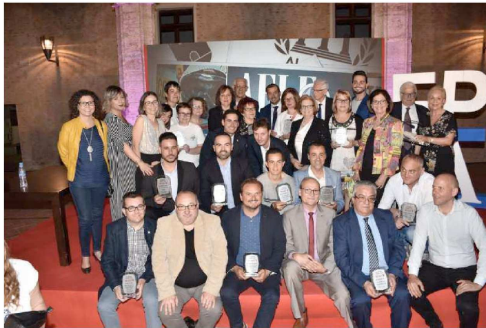
Premiados en la IV Gala Periódico de Aquí Horta Sud

Por primera vez se retransmitió por streaming desde los facebook del grupo y hubo un intérprete del lenguaje de signos para personas sordas