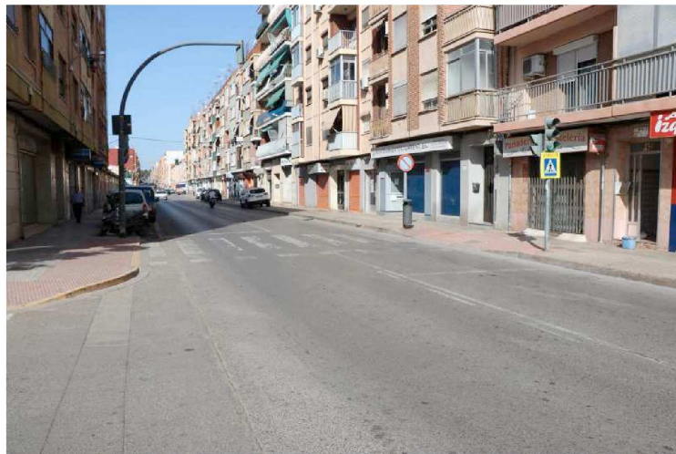
obres camí real

Las mejoras, enmarcadas en la estrategia EDUSI, contemplan las reformas de la antigua carretera comarcal