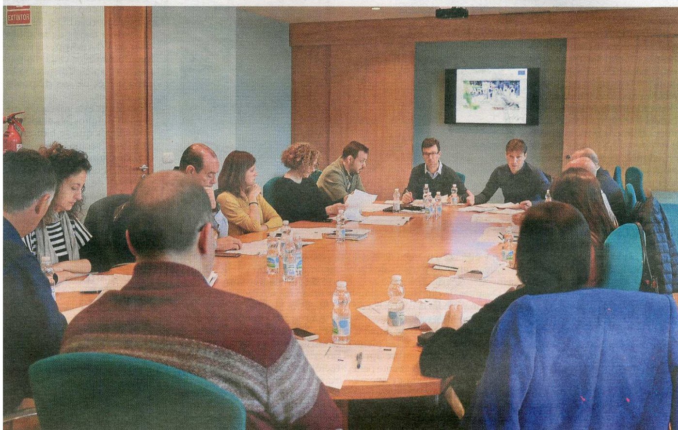
Los representantes de entidades en el comité de participación. LP